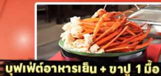
บุฟเฟ่ต์อาหารเย็น + ชาปู 1 มื้อ

25,919 บาท ราคาเริ่มต้น รวมภาษีมูลค่าเพิ่ม 7%