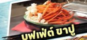
บุฟเฟต์ ชาบู