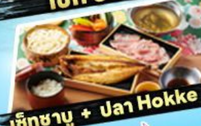
อิชิชาบู + ปาจา Hokke

ถนนคาบาสึ ซอยบิจิ ตลาดอะโม่โกะ ตลาดเช้า มิยาซากะ ถนนฮันมาจิซูกุ สะพานคาบาสึ