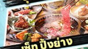
อิชิ บิงย่าง