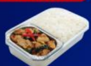
ข้าวกะเพราไก่