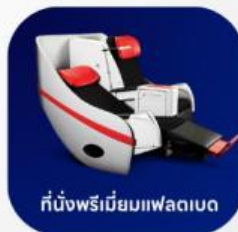
ที่นั่งพรีเมียมฟเลกซ์