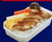
ข้าวหน้าไก่ย่างเทรียก