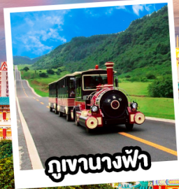
ภูเขาทางฟ้า