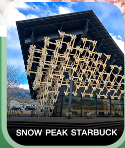
SNOW PEAK STARBUCK