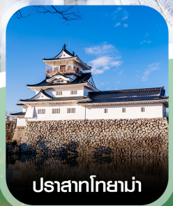
ปราสาทโทยาม่า

คอนเฟิร์มออกเดินทาง ทุกพีเรียด 2 ท่านขึ้นไป