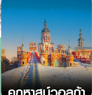
คฤหาสน์วอลก้า