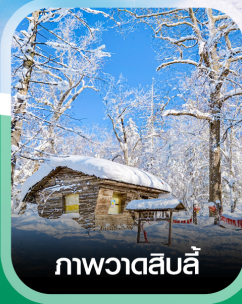
ภาพวาดสีสลับ