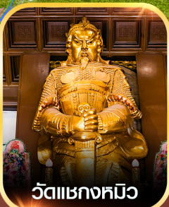
วัดแซกกงหิว

✈️ คอนเฟิร์มออกเดินทาง ทุกพีเรียด 2 ท่านขึ้นไป