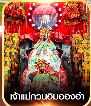
เจ้าแม่กวนอิมองค์