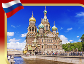
เข็ควินโบสถ์แห่งหยดเลือด