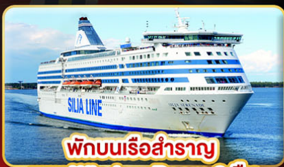
พักบนเรือสำราญ แบบ Window Room 2 คืน