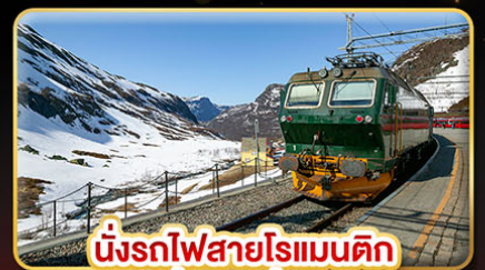
นั่งรถไฟสายโรแมนติก “พร้อมสปา”