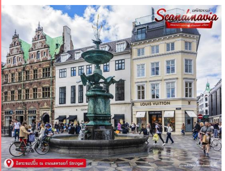
โคเปนเฮเกน COPENHAGEN

ให้ท่านได้ อิสระช้อปปิ้ง ณ ถนนสตรอยก์ (Strøget) ถนนคนเดินที่ยาวที่สุดในโลก ร้านบนถนนช้อปปิ้งสายหลักของเมืองนั้นเต็มไปด้วยแบรนด์ดังที่เราคุ้นเคยดี ตั้งแต่ Louis Vuitton ไปจน Urban Outfitter และ Zara ที่ไม่ว่าใครจะเข้ามาแล้วก็เมืองก็สาขา ก็ไม่สามารถหยุดขาตัวเองไม่ให้เดินเข้าไปซ้ได้ แต่ที่น่าสนใจมากกว่าคือ ร้านของแบรนด์ดีไซเนอร์ท้องถิ่นชื่อดัง อย่าง Wood Wood, Stine Goya, Henrik Vibskov ที่ตั้งอยู่บริเวณนี้เช่นกัน