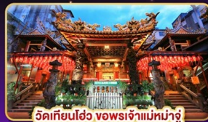
วัดเทียนโฮ่ว ขอพระเจ้าแม่มาจู่