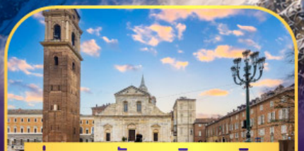
ถ่ายภาพกับมหาวิหารคูริน