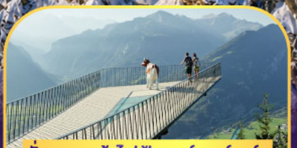
นั่งรถกระเช้าไฟฟ้า ชาร์เตอร์ ดูล์ม