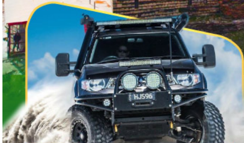
ขึ้นรถ 4WD สู่ใจกลางเทือกเขาคอเคซัส