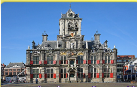
อาคารเมืองเก่าคลองเมืองเดลฟท์