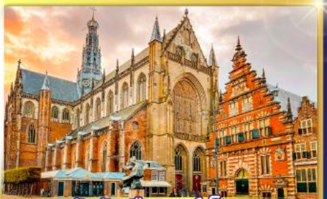
จัตุรัสเมืองฮาร์เล็ม

พรมแดนเมืองเปลาเกเนเธอร์แลนด์และเบลเยียม เดินเมืองเคลฟท์ เมืองเครื่องปั้นดินเผาระดับโลก ฮาร์เล็มเมืองมั่งคั่งที่สุดของเนเธอร์แลนด์