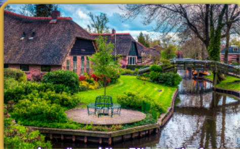
ล่องเรือหมู่บ้านไรด์นันทึร์รูน