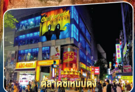
ตลาดซีเหมินตึง