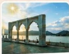
Ana Sagar Lake