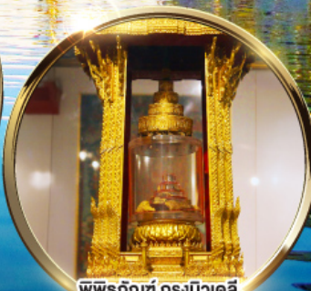
พิพิธภัณฑ์ กรุงนิวเดลี กราบนมัสการพระบรมสารีริกธาตุ