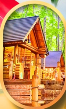
นิงเกิลทอเรีย