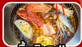
มือพิเศษ!!