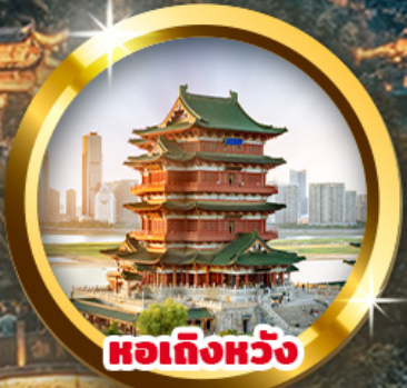
หอเท็งหวัง