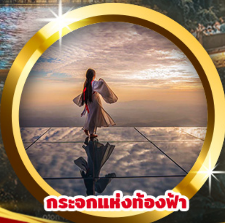
กระโจมแห่งท้องฟ้า