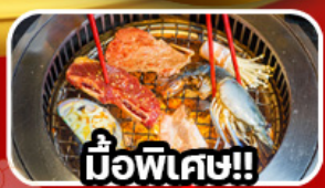
มือพิเศษ!!