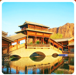
เมืองเล็กต้นเซียโ้ว