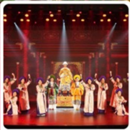
The Heritage Show

• ไอโอล์ก นั่งกระเช้าขึ้นยอดเขาบานาฮิลล์ ชมเมืองโบราณฮอยอัน สักการะเจ้าแม่กวนอิม