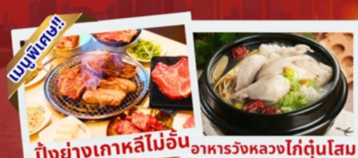
ปังย่างเกาหลีไม่อั้น อาหารวังหลวงไก่ตุ๋นโสม

เช็คอินห้องสมุดสุดอลังการ ชมศิลปะดิจิทัลสุดล้ำ บนจอ LED เสมือนจริงขนาดยักษ์ หมู่บ้านเกาหลีโบราณมุกซอน อื่นอีก อิสระช้อปปิ้ง 2 ย่านดัง ซองซู เมืองดง ช้อปปิ้งลดภาษี Lotte Duty Free