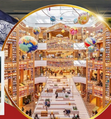
ห้องสมุด สตาร์ฟิลด์ ซูวอน

เช็คอินห้องสมุดสุดอลังการ ชมศิลปะดิจิทัลสุดล้ำ บนจอ LED เสมือนจริงขนาดยักษ์ หมู่บ้านเกาหลีโบราณมุกซอน อื่นอีก อิสระช้อปปิ้ง 2 ย่านดัง ซองซู เมืองดง ช้อปปิ้งลดภาษี Lotte Duty Free