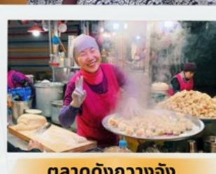
ตลาดดังกวางจิง