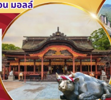
สักการะศาลเจ้าดัง ดาไซฟู