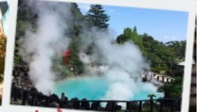
บ่อน้ำพุร้อน เบปปุ

เทศกาลชมดอกวิสทีเรีย ถนนคนเดินยูฟูอิน ฟลอร์ วิลเลจ ทะเลสาปคินริน บ่อน้ำพุร้อน อุมิจิกุ โทสุ ฟรีเมียมเจ้าท์เลท ท่าเรือ โมจิโกะ เรโทร ตลาดปลาคาราโตะ ศาลเจ้ามียาจิดาเกะ ดิโตะคิวกุ ฟุกุโอกะ เบย์ พลาซ่า ช้อปปิ้งอ็ออน มอลล์