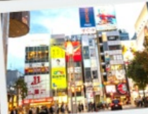
ช้อปปิ้งเทนจิน