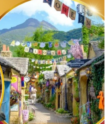
ถนนคนเดินยูฟูอิน ฟลอร์ริ