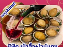
ซีฟูด เป้าฮ้อ+ไฉนแดง