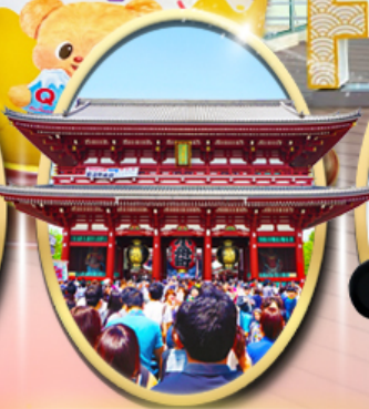
วัตซึบิรี่