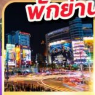
ย่านซิเหมินตง