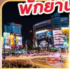
ย่านซีเหมินติง