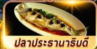
ปลาประรานาธิบดี