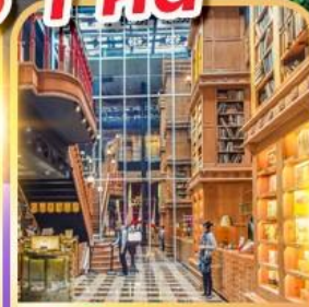
ร้านไอศกรีมมียาฮาร่า