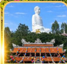
วัดลองเซิน