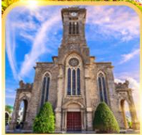
โบสถ์หินญาจาง