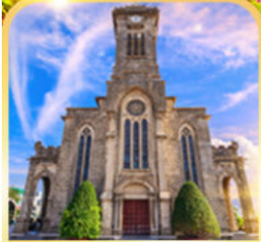
โบสถ์หินญางาง