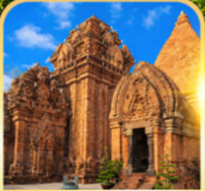
Po Nagar Cham