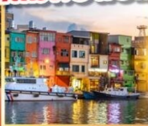
ท่าเรือประมงเจิ้งปิ่น