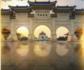
อนุสรณ์เจียงโคเชก