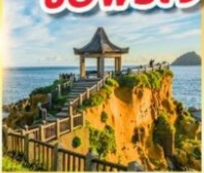
เกาะเหอผิง

พักย่านซีเหมินติง 2 คืน ขอพรเจ้าแม่กวนอิมพันมือ