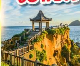
เกาะเหอผิง

พักย่านซีเหมินติง 2 คืน ขอพรเจ้าแม่กวนอิมพันมือ