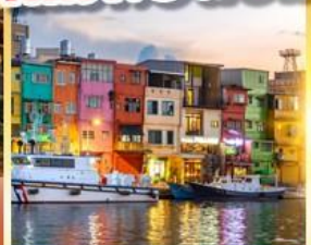
ท่าเรือประมงเจิ้งปิ่น