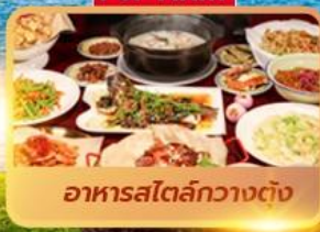
อาหารสตรีทกวางตุ้ง