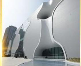
โรงละครโดง