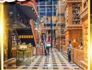
ร้านไอศกรีมมียาฮาร์