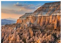
เมืองคัปปาโดเกีย

** พักที่ Dedeli Cave Hotel 5* หรือเทียบเท่า **