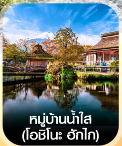
หมู่บ้านน้ำใส (โอะชิโนะ ฮักไก)

✈️ คอนเฟิร์ม ออกเดินทาง ทุกพีเรียด 2 ท่านขึ้นไป