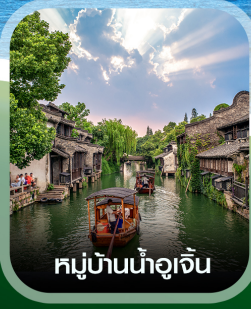
หมู่บ้านน้ำอู๋จิน

คอนเฟิร์มออกเดินทาง ทุกพีเรียด 2 ท่านขึ้นไป