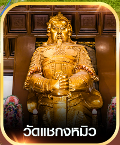
วัดแฆกหมีว

✈️ คอนเฟิร์มออกเดินทาง ทุกพีเรียด 2 ท่านขึ้นไป