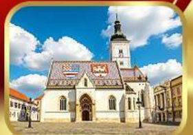
โบสถ์เซ็นต์มาร์ก ซาเกรบ