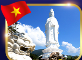
ชมพระอัครมถวิม วัดหลินฮืง