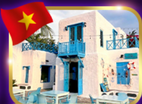
คาเฟ่สุดชิค ซานตรา มาริน่า