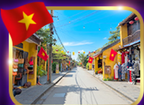
เมืองท่ามรดกโลก ฮอยอัน