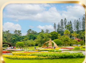
สวนบ้านปรน.เจียงไคเช็ก