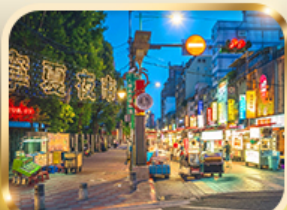
หนิงเซี่ย ไทน์มาร์เก็ต