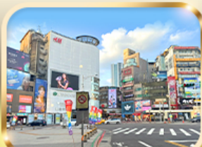
ช้อปปิ้งย่านซีเหมินติง