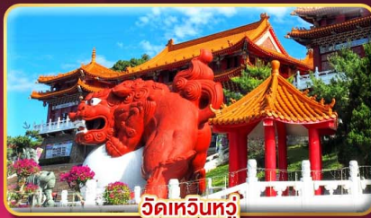
วัดเหอฮินทง