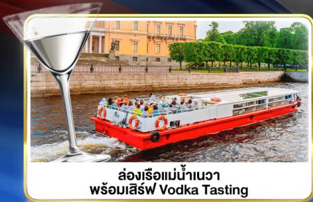
ส่องเรือแม่น้ำเนวา พร้อมลิ้ม Vodka Tasting

📅 เดินทาง : 14-21 มิ.ย.69 / 28 มิ.ย.-05 ก.ค.69 / 24-31 ก.ค.69