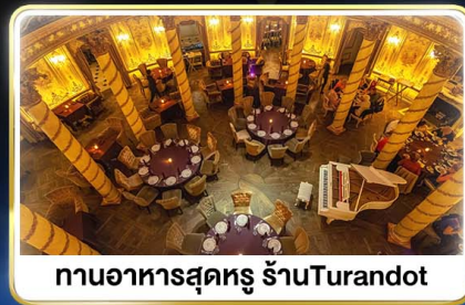
ทานอาหารสุดหรู ภัตตาคารTurandot