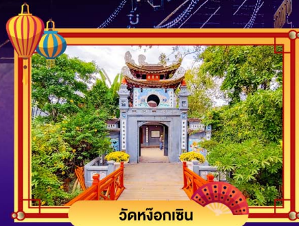
วัดหังจอกเซิน