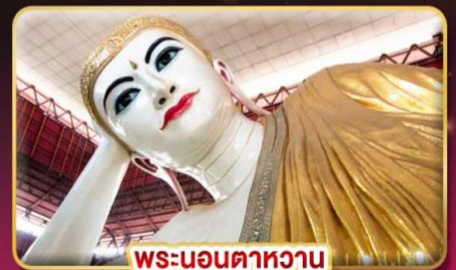
พระนอนตาทวน