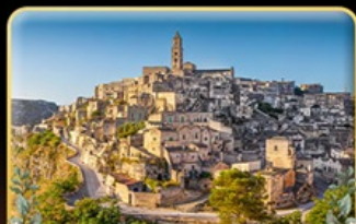
ตามรอย 007 เมือง Matera