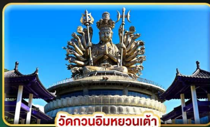
วัดกวนอิมหยวนเต้า