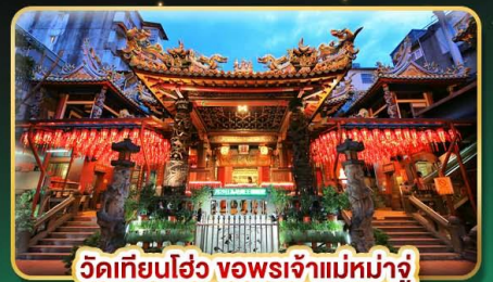
วัดเทียนอ้อ่ว จอพระเจ้าแม่หม่าจู่