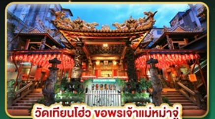
วัดเทียนฮั่ว ขอพระเจ้าแม่มาจู้