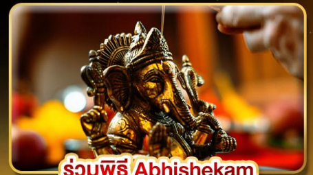
ร่วมพิธี Abhishekam