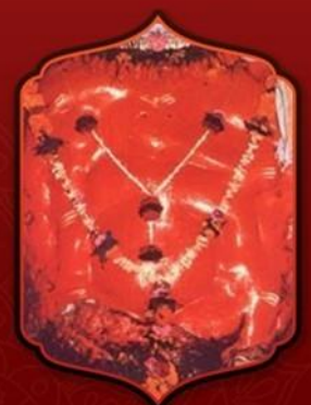
องค์ศรีศรีจัตมา

ทำให้ท่านขอบุตรได้ และจะได้บุตรที่ดีมีปัญญาหลักแหลม