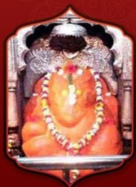
องค์ศรีมหาคณปติ