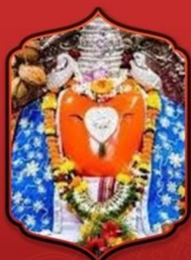
องค์ศรีบัลลาลศวา

ทำให้ท่านได้รับพรทุก ๆ อย่าง ที่ขอจากองค์พระพินาศ