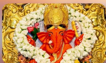
องค์สิทธินายก