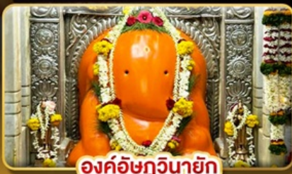
องค์อชฏวินายัก