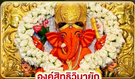
องค์สิทธินายก

เปิดรับความสำเร็จ..สักการะ พระพิฆเนศ 10 องค์