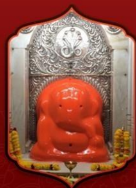
องค์ศรีโมเรศวา

ทำให้ท่านชีวิตปราศจาก อุปสรรคและอันตรายใดๆทั้งปวง