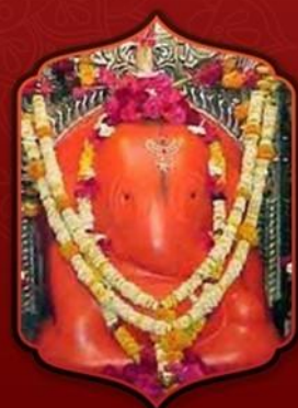
องค์ศรีจินดามณี

ทำให้ท่านสมหวังดังได้อธิษฐาน ต่อลูกแก้วจินดามณี