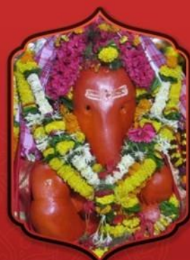
องค์ศรีวรรตวินายักษ์

ทำให้ท่านจะให้หายป่วยจากโรคร้ายไข้เจ็บ ทั้งปวงและทำให้สุขภาพแข็งแรง