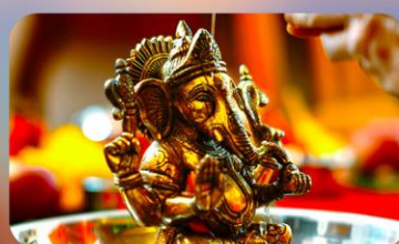
ร่วมพิธี Abhishekam