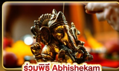
ร่วมพิธี Abhishekam