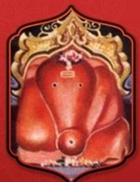
องค์ศรีสิทธิวินายักษ์

ทำให้ท่านประสบความสำเร็จ ในเรื่องงานราบรื่นทุกประการ