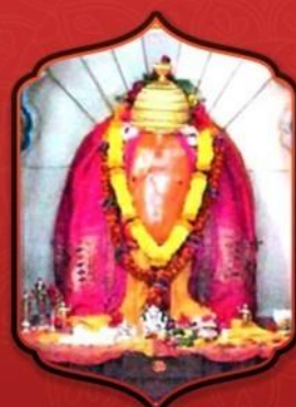
องค์ศรีวิขเนศวา

ผู้ขจัดอุปสรรคและภัยอันตราย ทำงานได้สำเร็จราบรื่น ไร้อุปสรรค