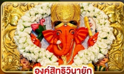
องค์สิทธินายัก