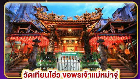
วัดเทียนโฮ่ว ขอพรเจ้าแม่มาจู่