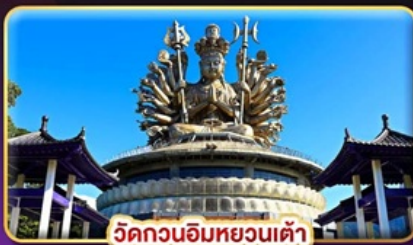
วัดกวนอิมหยวนเต้า