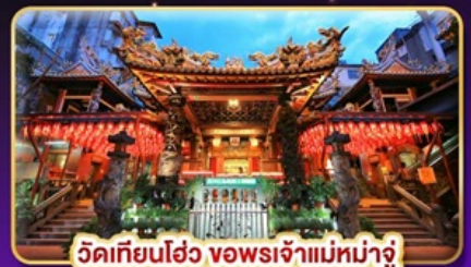
วัดเทียนฮั่ว ขอพระเจ้าแม่มาจู