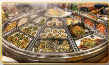
หม้อนึ่งจักรพรรดิ