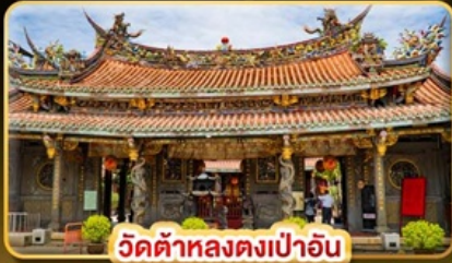
วัดต้าหลงตงเปาอัน