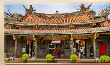
วัดต้าหลงตงเป่าอัน