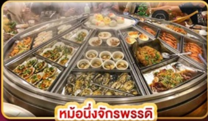
หม้อนึ่งจักรพรรดิ

แพคเกจตั๋วเครื่องบินทางรถไฟผิงซี บินคุ้ม เที่ยวครบ เช็किनจุดไฮไลท์