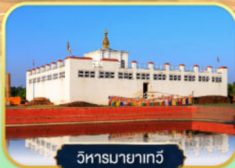
วิหารมายาเทวี