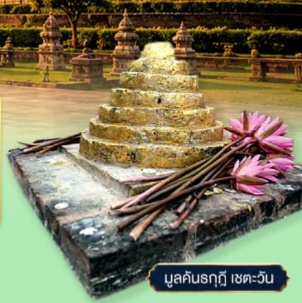
มุลคินรฤฎี เขตะวัน