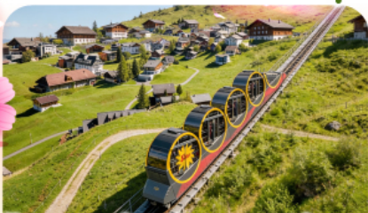
ขบวนรถไฟที่ชันที่สุดในโลกสู่สตูล

พิชิตยอดเขาขุนเนกกา 1 ในเขาที่สวยงามที่สุดเมืองเซอร์แมท