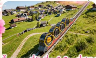
ชั้นรางที่ชันที่สุดในโลกสู่สตูล

พิชิตยอดเขาชุนเนกกา 1 ในเขาที่สวยงามที่สุดเมืองซอร์แมก