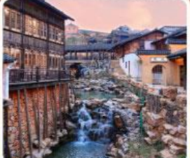
เมืองโบราณเหยาหู