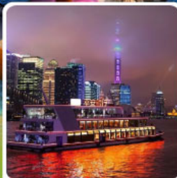
ล่องเรือแม่น้ำหวงผู่