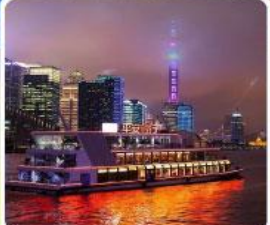
ล่องเรือแม่น้ำหวงผู่