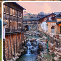
เมืองโบราณเหย้าหู