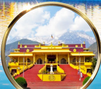
ดาริมซาล่า "ธรรมศาลา" คำนึงองค์ดาโลลามะ